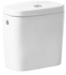
Cisterna de doble descarga 6/3L con alimentación inferior para inodoro