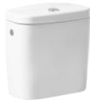
Cisterna de doble descarga 6/3L con alimentación inferior para inodoro